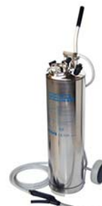
Indu-Matic 20 M