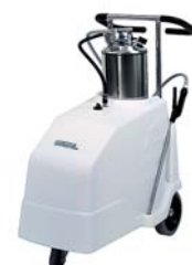
Foam Cleaner 20