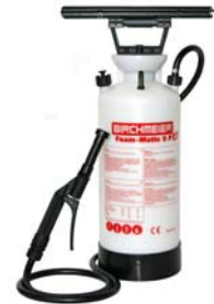
Foam-Matic 5 P