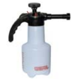
Foam-Matic 1.25 P