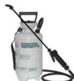
Rondo-Matic 5 E