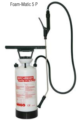
Foam-Matic 5 P mit Verlängerung 50 cm Edelstahl gebogen